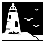
Paul V. Sherlock Center on Disabilities

2023 Paul V. Sherlock Center on Disabilities / Rhode Island College